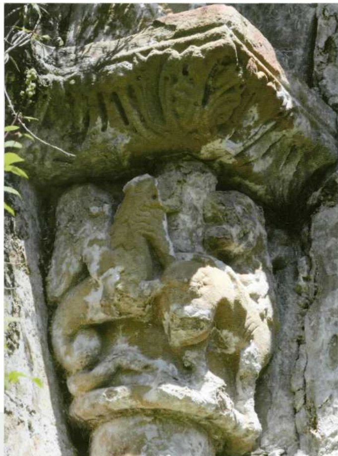
Capitel de la ventana meridional. Dragón atacando a un león

sacristía. Por último, en el tramo oeste de la nave se debió de instalar una tribuna de madera en el siglo XVIII, de la que quedan sólo los huecos para insertar las vigas. De esta época podría datar el recinto adosado al muro norte de la nave en la zona de los pies.