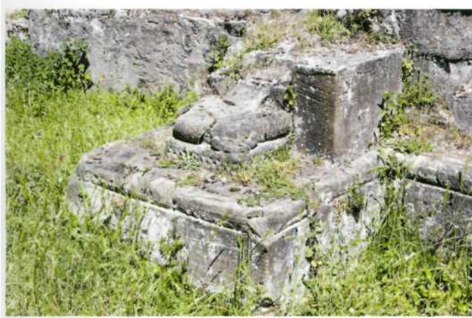
Basamento del arco triunfal