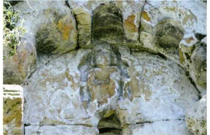
Timbano de la ventana meridiana