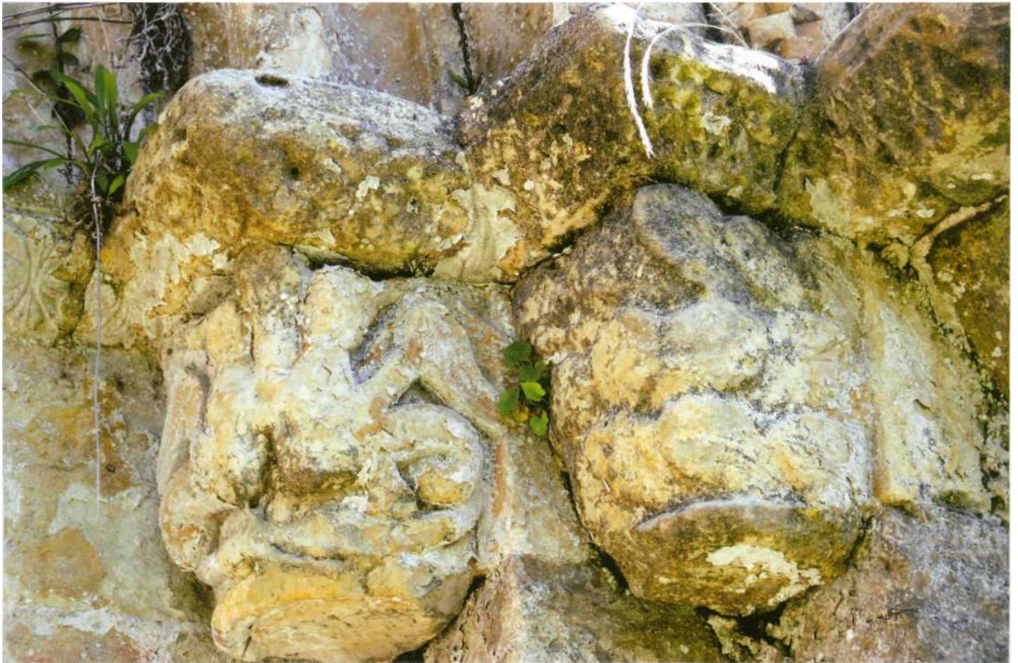
Capiteles del lado derecho de la portada

En fin, en Plecín se han identificado restos de pintura que han hecho sugerir a M. P. García Cuetos que debía de estar revocada y pintada al modo de las iglesias palentinas. En el curso de las excavaciones arqueológicas realizadas en el templo se encontró en las proximidades de Alies una lauda sepulcral, posiblemente románica, que en ese momento formaba parte del remate de cierre de una finca denominada "El Corral", a unos 150 m en línea recta del templo. Se trata de una pieza de perfil rectangular, que mide 176 cm de largo, 67 de ancho y 15 de grosor; tiene forma trapezoidal y sección transversal triangular. Centrada en la cara superior y muy erosionada se labra, en altorrelieve, una espada con empuñadura en forma de cruz y punta roma.