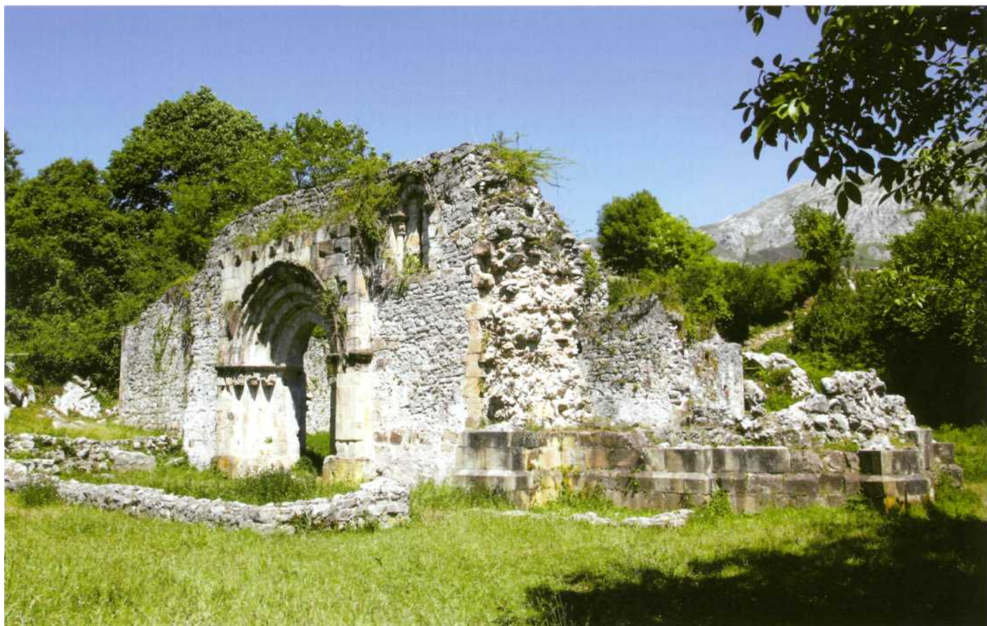
Panorámica desde el lado sur

El acceso principal del templo se abre en el muro meridional. Se trata de una portada cuya estructura repiten los accesos principales de algunas de las iglesias del espacio oriental de Asturias, en ellas, el abocinamiento generado por la multiplicación del número de arquivoltas se inserta en un cuerpo en resalte respecto a los muros de la nave, que se cubre con un tejazoz que cobija una hilera de canecillos. La parte inferior se refuerza por un zócalo abocetado. Se estructura esta portada en cuatro arquivoltas ligeramente apuntadas, que se protegen con un guardapolvo decorado con nido de abeja. Se ornamentan con los siguientes motivos, de la más interna a la más externa: borde recorrido por una doble hilera de medios círculos enfilados, borde abo celado, borde abocelado y taqueado, media caña y bocelillo fino. El conjunto de arquivoltas arranca de una línea de imposta que se desarrolla a lo largo del lienzo que enmarca