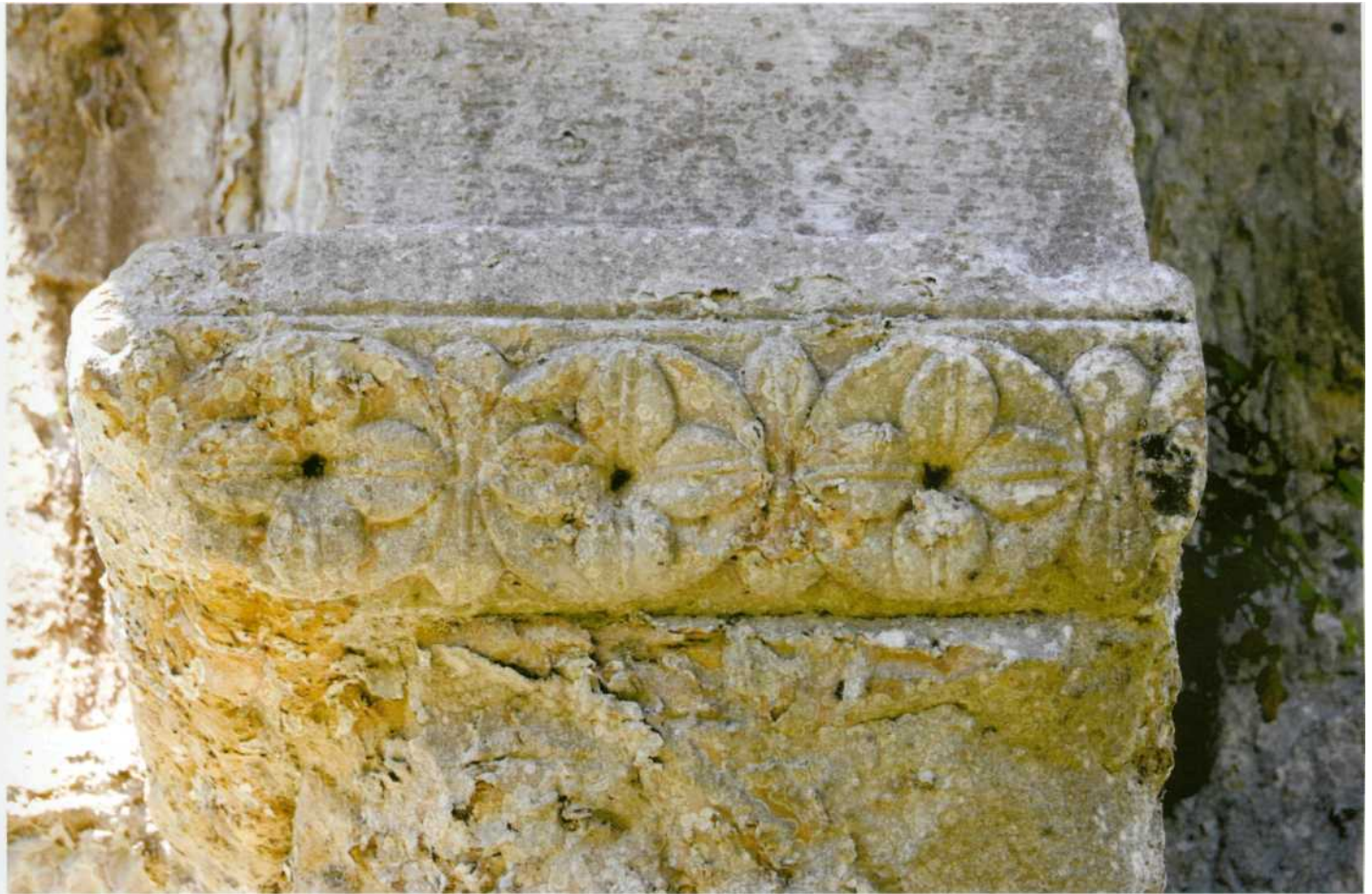
Detalle de la imposta de la portada

cionados se situarían entre 1150 y 1200 (en 1172 se consagró la iglesia de Piasca). Por todo esto, los vestigios conservados de San Pedro de Plecín poseen una singular importancia dentro del románico asturiano, al evidenciar la llegada de los talleres tardorrománicos del norte de Castilla con su particular iconografía, y nos ayudan a explicar su difusión.